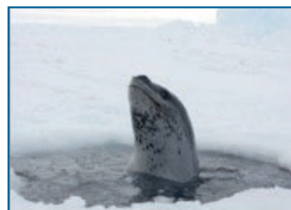
Морской леопард в полынье