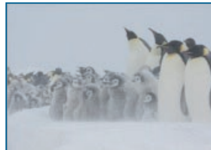
Колония императорских пингвинов в плохую погоду