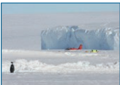
Лагерь у айсберга рядом с колонией императорских пингвинов