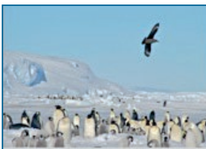
Южнополярный поморник кружит над колонией пингвинов