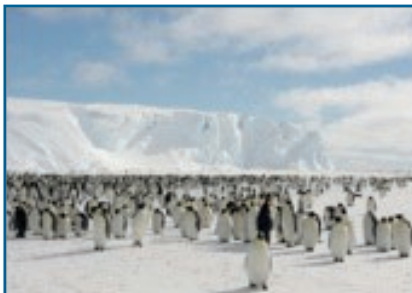
Колония императорских пингвинов в хорошую погоду