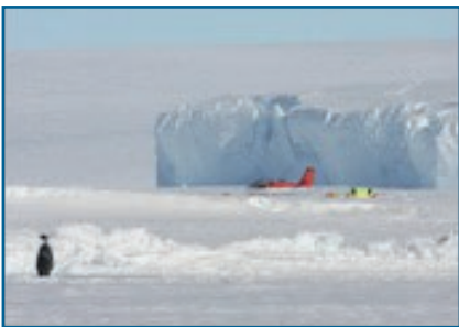
Campamento junto a un iceberg en la colonia de pingüinos emperador