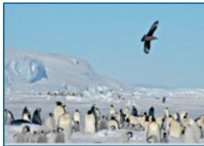
Págalo polar sobrevolando la colonia