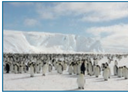
Colonia de pingüinos emperador con buen tiempo