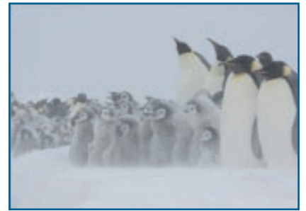
Colonia de pingüinos emperador con mal tiempo