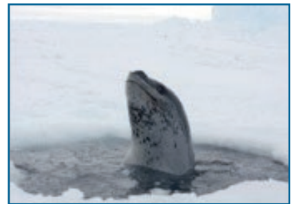
Foca leopardo en un agujero de respiración