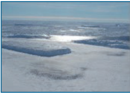
Vista aérea de una colonia de pingüinos emperador