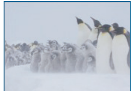
Keizerspinguïnkolonie bij slecht weer