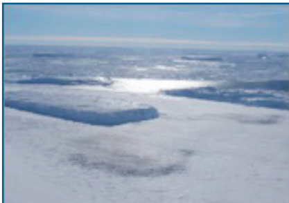
Luchtfoto van keizerspinguïnkolonie