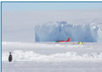
Kamp nabij ijsberg bij keizerspinguïnkolonie