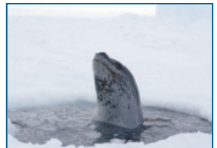
Zeelupaard bij ademgat