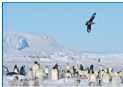
Zuidpooljager overvliegt kolonie