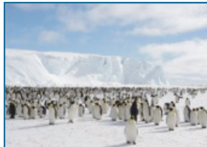
Keizerspinguïnkolonie bij mooi weer