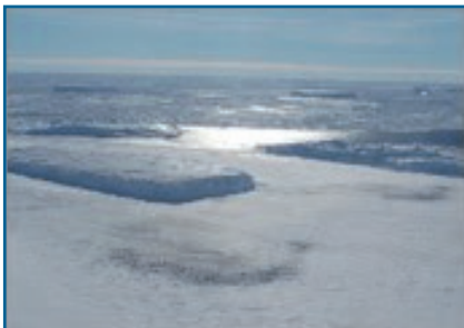
Luchtaanzicht van een keizerspinguïnkolonie